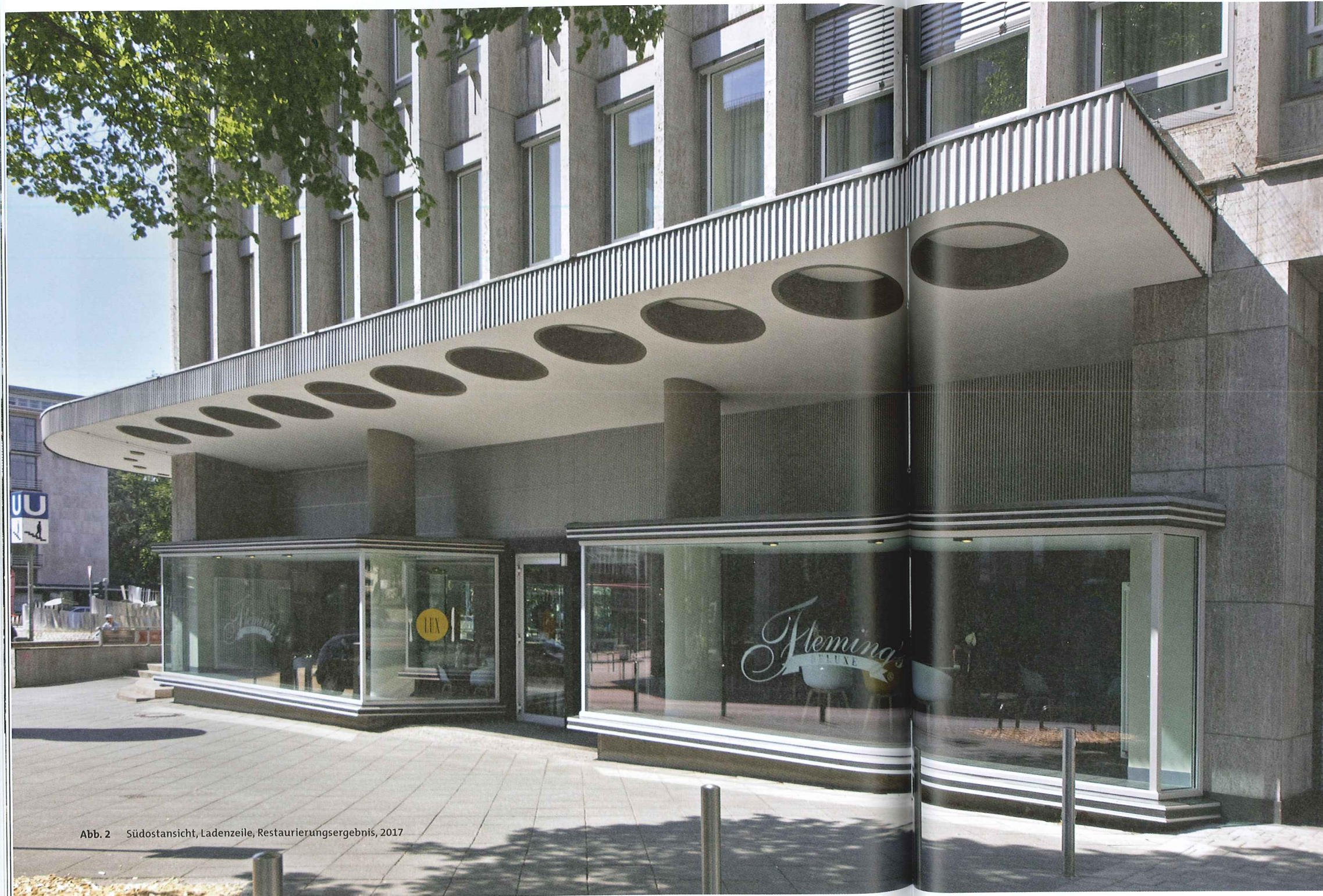
Abb. 2 Südostansicht, Ladenzeile, Restaurierungsergebnis, 2017