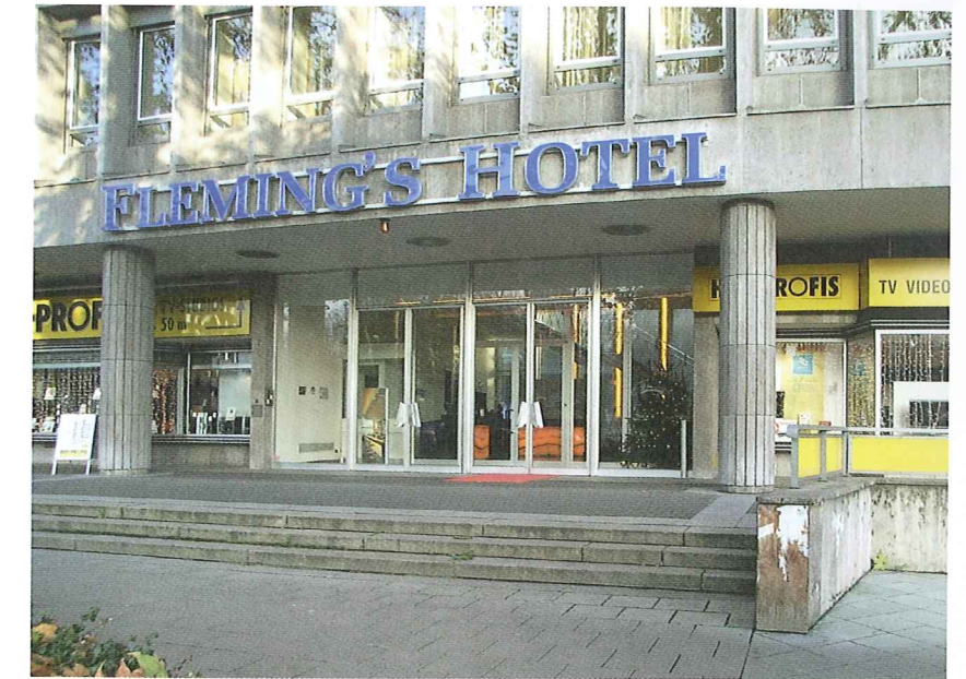
Abb. 5 Westfassade, Hoteleingang (Vorzustand)

Das „Bayerhaus“ besticht durch das hohe Staffelgeschoss und sein nach Osten abfallendes Pultdach, welches nach Westen als kräftig vorspringendes Flugdach ausgebildet ist. Die Dachterrasse bietet einen spektakulären Ausblick auf die Stadt. An das Hochhaus fügt sich im rechten Winkel ein niedrigerer, viergeschossiger Flügel. Im Erdgeschoss beider Gebäudeteile war ursprünglich jeweils eine Zeile mit Läden für den gehobenen Bedarf integriert, deren aufwendige Schaufensteranlagen vitrinenartig ausgebildet waren (Abb. 1 und 2). Die Erdgeschossfassade war spätestens mit der Inbesitznahme der beiden Ladenzeilen durch ein Geschäft für Radio- und Fernsehtechnik verunstaltet. Dessen plakative Werbeanlagen hatten erhebliche nachteilige Auswirkungen auf das Erscheinungsbild des gesamten Gebäudes, was durch eine Verblendung des ursprünglich offenen Bereichs über den Schaufenstern noch