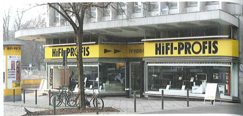
Abb. 1 Südostansicht, Ladenzeile, Vorzustand, 2011

Maßnahme: Umgestaltung des Foyers im Rahmen einer baulichen Erweiterung, Restaurierung der Ladenzone, 2013-2015