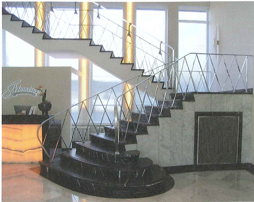
Abb. 7 Historisches Foyer und Treppenhaus-Verglasung, Vorzustand, 2009