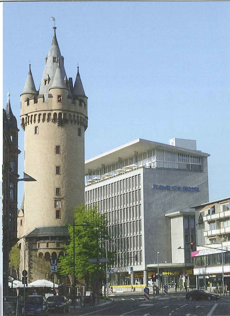
Abb. 3 Südansicht, Dach mit Technikaufbau, Vorzustand, 2011