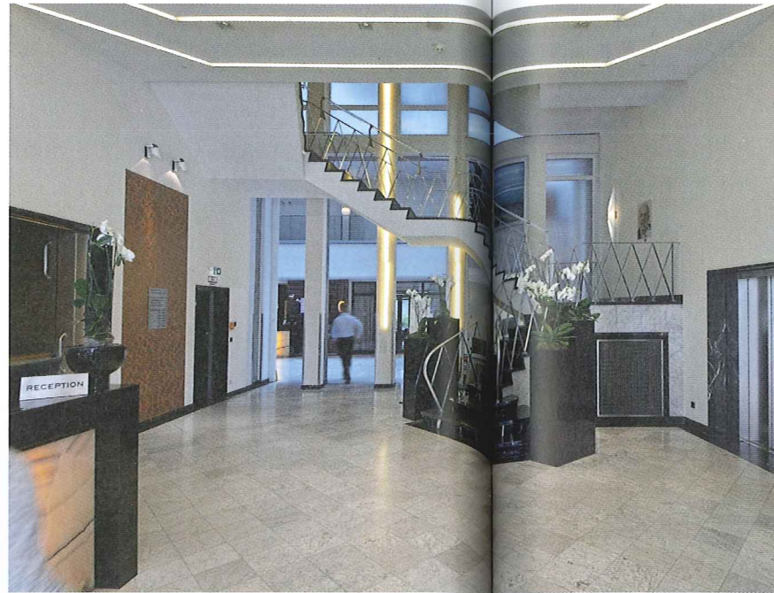
Abb. 8 Historisches Foyer mit Haupttreppenhaus, nach Herstellung der Verbindung zur neuen Lobby, 2017