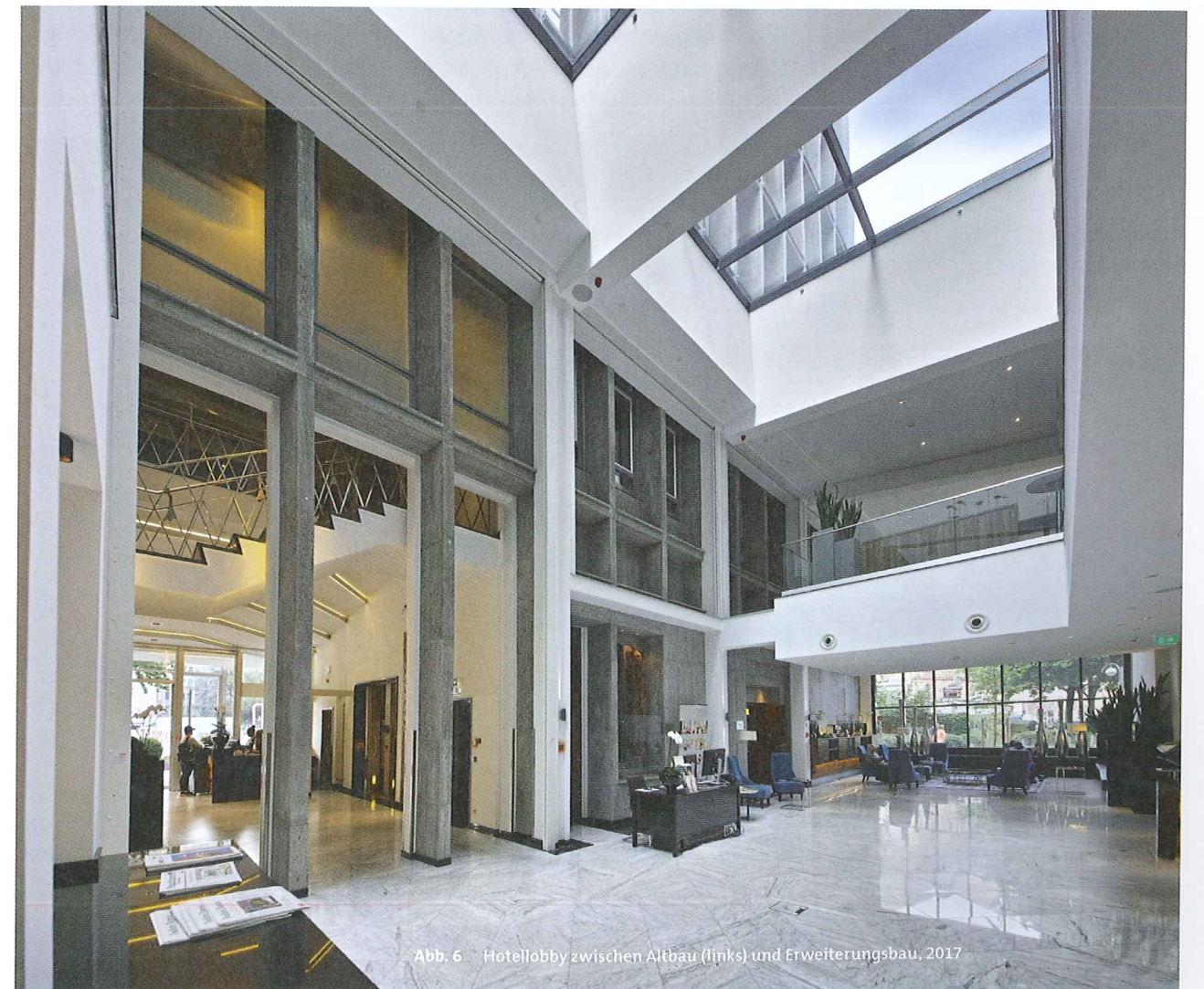
Abb. 6 Hotellobby zwischen Altbau (links) und Erweiterungsbau, 2017

chem Ausmaß sich abschnittsweise der Bereich oberhalb der Schaufensteranlagen verändert hatte. Neben der notwendigen energetischen Erhöhung der ehemaligen Schaufenster (hier durch eine in ihrer Profilstärke minimierte Isolierverglasung) war Ziel, den architektonisch anspruchsvollen Zustand der Erbauungszeit wiederzugewinnen. Durch das Entfernen der Verkleidungen oberhalb der zur Bleichstraße orientierten Schaufenster wurden zugleich auch die Pfeiler oberhalb der Vitrinen wieder freigestellt. Die historischen Schaufensteranlagen und die ehemaligen Ladentüren blieben – restauriert – erhalten. Die bauzeitliche Farbgebung der Dach-Unterseite mit ihren kreisrunden Öffnungen erfolgte auf Grundlage restauratorisch ermittelter Befunde. Die bereits vor der Sanierung abgedeckten – ursprünglich allerdings offenen – kreisrunden Ausschnitte im Vordach