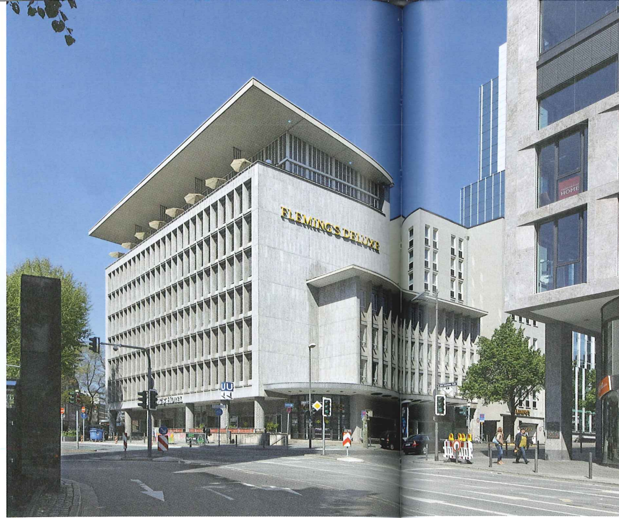
Abb. 4 Südansicht, nach Entfernung des Technikaufbaus, 2017