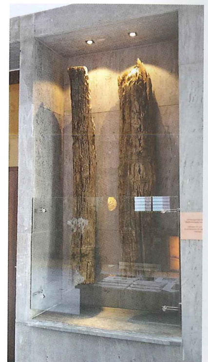
Abb. 11 Hotellobby, Gründungs-Pfahlrost der spätmittelalterlichen Stadtmauer, 2017

mach. Eine vom Bundesarbeitsministerium erlassene Betriebssicherheitsverordnung hätte beinahe das Aus für eine freie Nutzung von Paternostern bedeutet. Sie wurde schließlich auf Veranlassung des Bundesrates dahingehend modifiziert, dass auf die Gefahren der Nutzung grundsätzlich deutlich sichtbar hingewiesen werden muss. Die beiden Paternoster im Gebäude erfreuen sich wieder hoher Beliebtheit. In der neuen Hotellobby werden in einer Wandnische zwei Bestandteile eines von der Bodendenkmalpflege bei den Ausschachtungsarbeiten zum Neubau entdeckten Gründungs-Pfahlrostes (dendrochronologisch datiert auf das Fälljahr 1445) der mittelalterlichen Stadtbefestigung präsentiert (Abb. 11) – ein kleiner Hinweis auf den bedeutsamen historischen Ort.