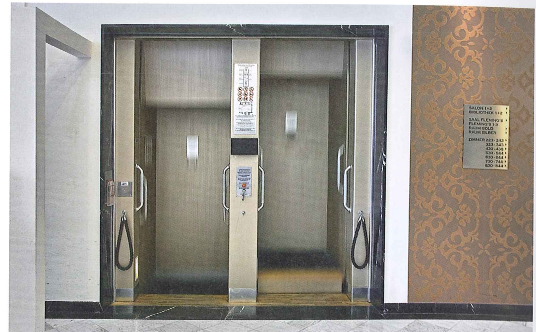
Abb. 10 Paternoster in Betrieb, 2017

blieben verschlossen, um Passanten bei Regen nicht wieder der direkten Witterung auszusetzen. An der Vordachkante wurde die für die Bauzeit typische Verkleidung aus Wellblech entsprechend dem Original wiederhergestellt.